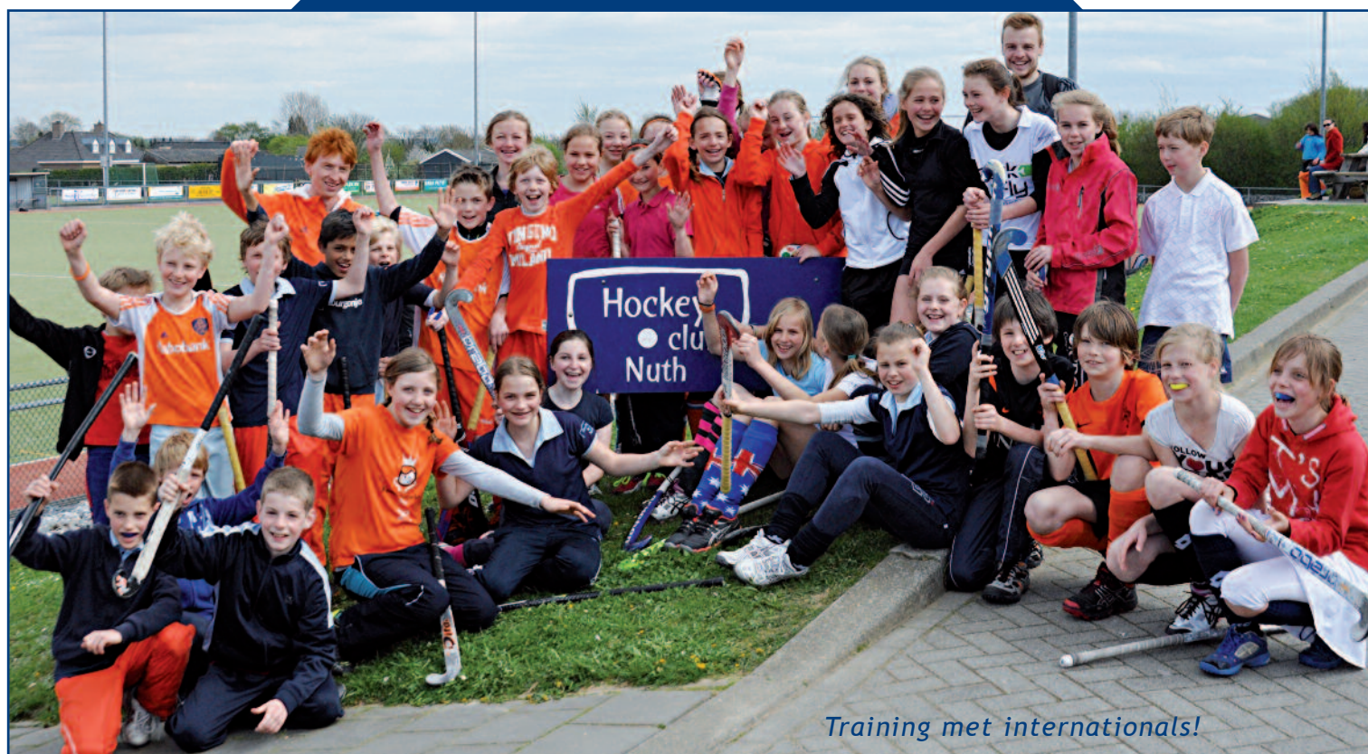
Training met internationals!

Tenslotte willen we meer zijn dan ‘alleen’ een sportvereniging. Wij pakken als HCN onze rol op in de participatiemaatschappij van vandaag. Zo werken we samen met Kompas om bijstandsgerechtigden werkervaring te laten opdoen op weg naar betaald werk. Scholieren die hun maatschappelijke stage bij HCN willen vervullen, kunnen zich hiervoor bij het bestuur melden.