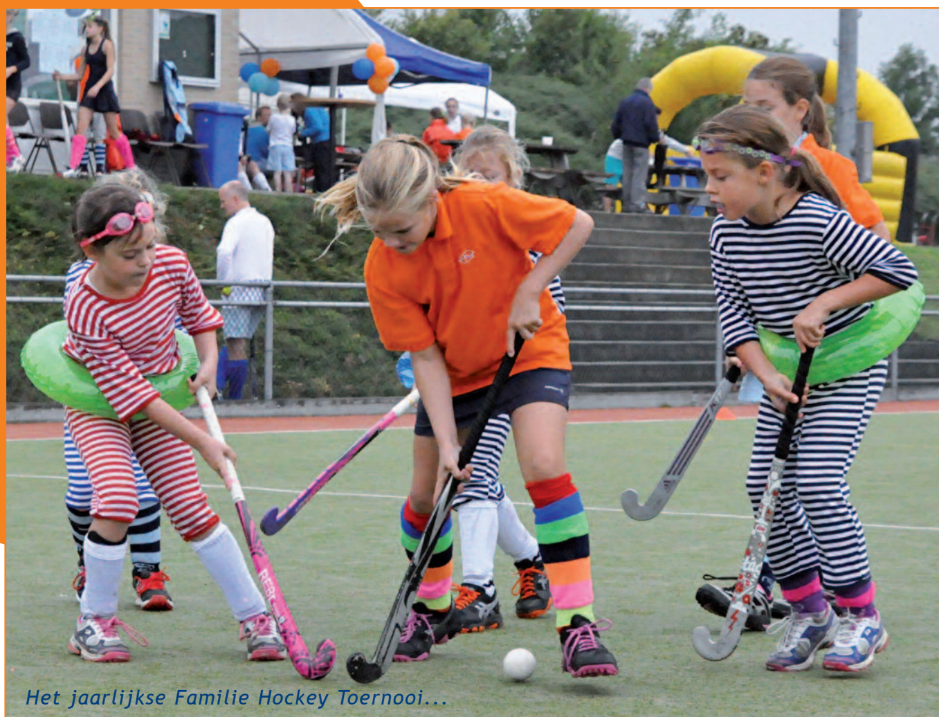
Het jaarlijkse Familie Hockey Toernooi...