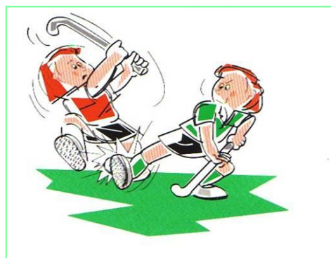
De tegenstander duwen