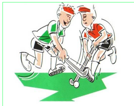
Op de stick slaan van de tegenstander