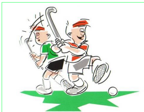
Gevaarlijk zwaaien met de stick