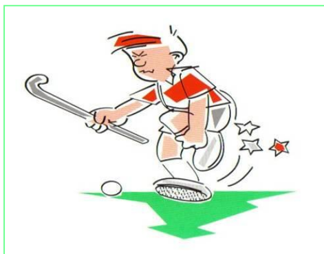
De bal met de voet spelen