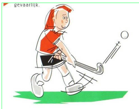
De bal hoog spelen