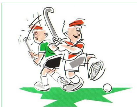
Gevaarlijk zwaaien met de stick