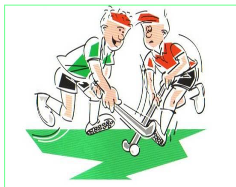
Op de stick slaan van de tegenstander