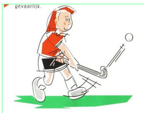
De bal hoog spelen