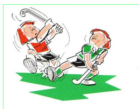
De tegenstander duwen